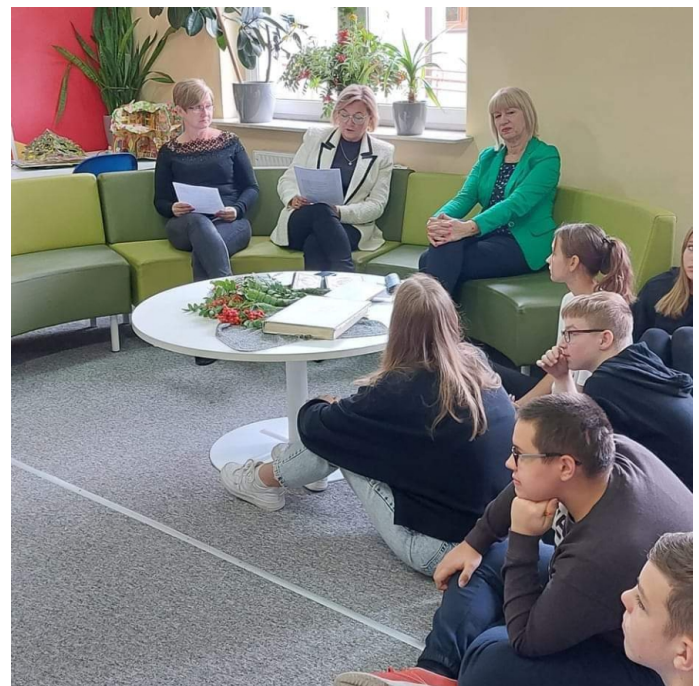
Narodowe Czytanie SP 3