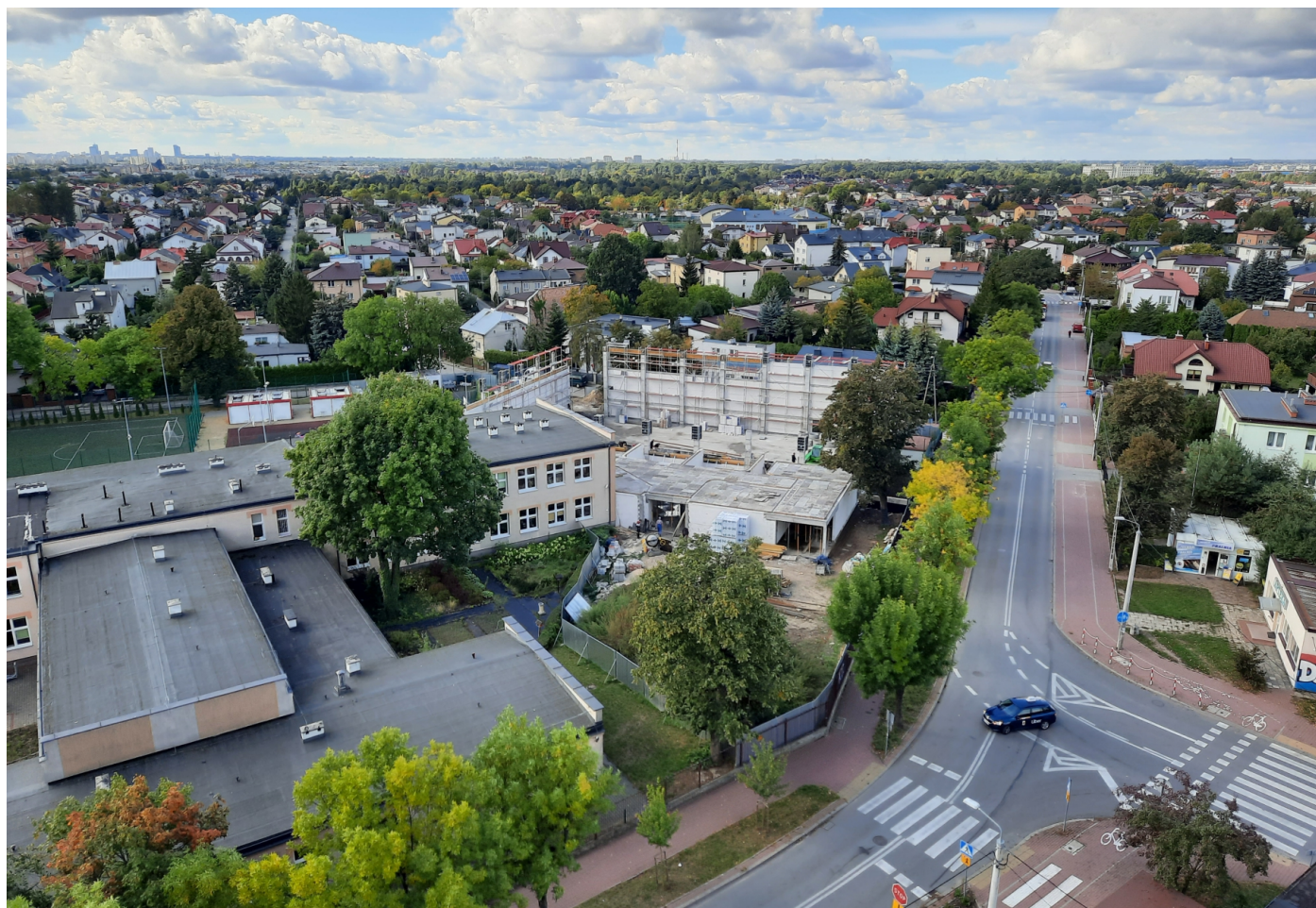
Widok na budowę hali sportowej przy SP2

Trwają prace przy budowie nowej sali gimnastycznej wraz z zapleczem przy Szkole Podstawowej nr 2 w Ząbkach. W obiekcie znajdować się będą boisko do piłki ręcznej, koszykówki, siatkówki i badmintonu wraz z zapleczem sanitarnym i szatnią oraz dwupoziomowa trybuna dla widowni. Obiekt będzie spełniał współczesne normy, w tym związane z oszczędnością energii, i posłuży wielu przyszłym pokoleniom.