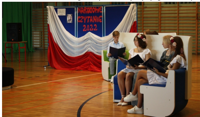
Narodowe Czytanie SP 5

W bieżącym roku dzieci mogły przekonać się, że dzieła dawnych mistrzów są ponadczasowe i mogą także dziś wzruszać, rozśmieszać i zaciekawiać. Społeczność Szkoły Podstawowej nr 1 zaczęła swoje czytanie w piątek, 2 września, w dzień poprzedzający finał 11. odsłony Narodowego Czytania. Każdego roku Para Prezydencka wskazuje konkretne dzieło do Narodowego Czytania, łącząc jego tematykę