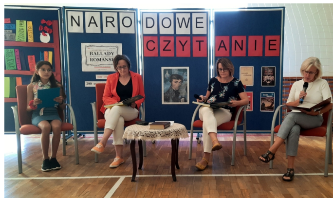
Narodowe Czytanie SP 1

Redaktor Naczelny: Łukasz Majchrzyk tel. 570 394 381; e-mail redaktor@zabki.pl ,