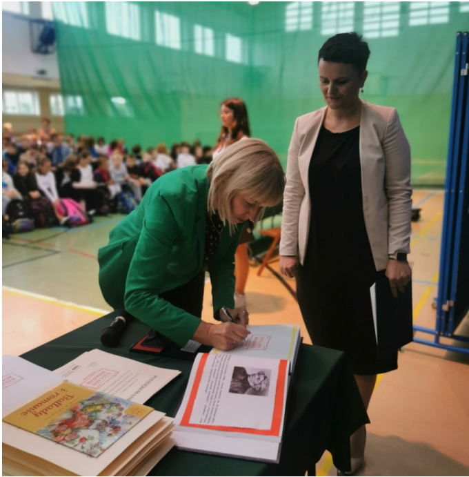
Narodowe Czytanie SP 4