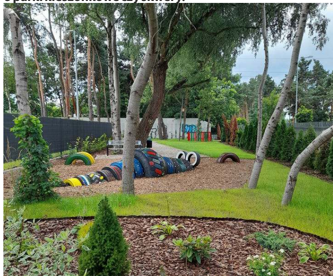
EKO-SKWER przy ul. Zycha

- Pani priorytetem wydają się inwestycje mniejsze, ale z których mieszkańcy korzystają na co dzień. Chodzi np. o parki kieszonkowe czy skwery.