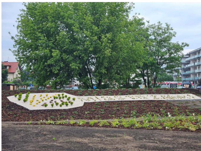
Park przy ul. Różanej