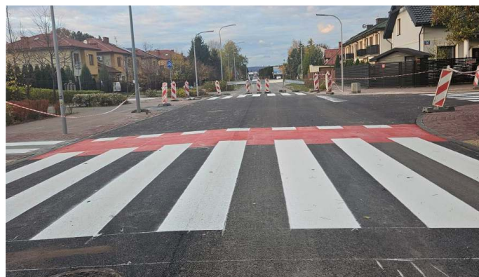
Wyniesione Skrzyżowanie wraz z oświetleniem w ul. Wolności z ul. Piotra Skargi