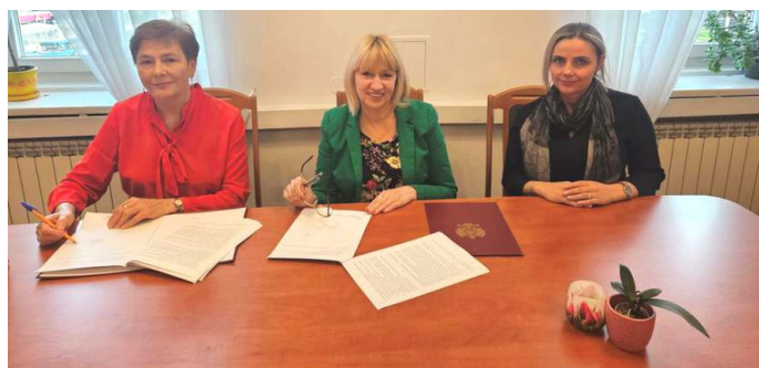
Podpisanie umowy na dofinansowanie na budowę Centrum Monitoringu Miejskiego