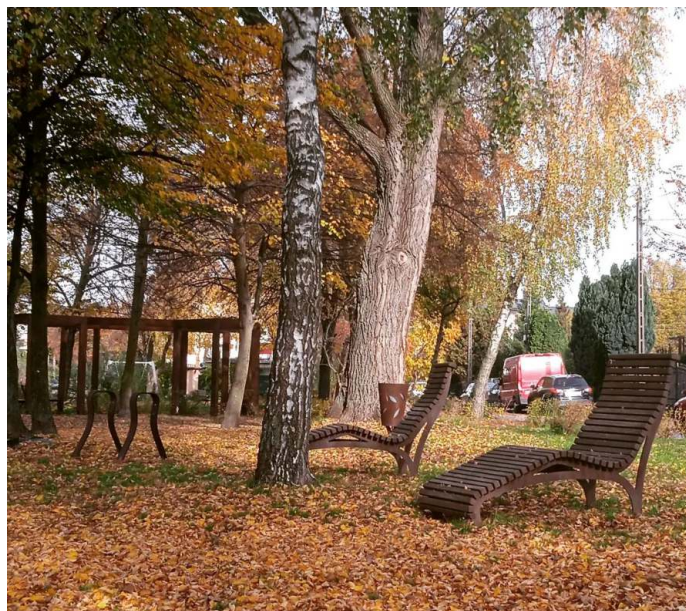
Skwer przy ul. Gałczyńskiego

- Na skwerach i przy drogach zrobiliśmy liczne nasadzenia zieleni. Od początku bieżącej kadencji samorządu rozpoczęliśmy realizację projektu „Zielona przestrzeń – rozwój i modernizacja terenów zieleni w mieście Ząbki”. W latach 2019-2020 posadziliśmy ponad 200 drzew różnych gatunków, m.in. pięknie kwitnące śliwy wiśniowe przy ul. Złotej, dęby, kasztany czerwone i magnolie na placu przy ul. Słowackiego, lipy drobnolistne wzdłuż ul. Lipowej oraz ozdobne wierzby japońskie w pasażu na Orlej. Nasadzenia drzew uzupełniliśmy krzewami, bylinami, pnączami i trawami ozdobnymi. Posadziliśmy łącznie około 50.000 roślin, w tym prawie 4,7 tys. sadzonek bluszczu pospolitego o właściwościach oczyszczających powietrze. Przy ulicach Kołłątaja i Gajowej powstały piękne skwery z urozmaiconą roślinnością. Zagospodarowaliśmy pasy zieleni wzdłuż 37 ulic, 6 skwerów i w Parku Szuberta .