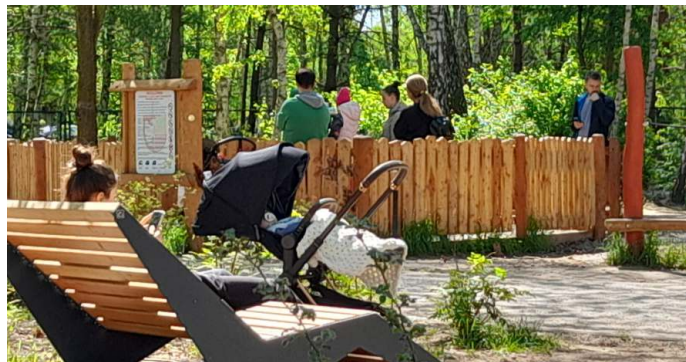
Park przy ul. Powstańców