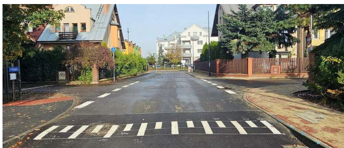
Wyniesione skrzyżowanie pomiędzy ul. Tulipanową i Gajową

Na skrzyżowaniu ulic Tulipanowej i Gajowej przy ul. Sikorskiego wybudowane zostało wyniesione skrzyżowanie. Zakończył się także remont ulic Tulipanowej, Kołłątaja, Harcerskiej i Obrońców.