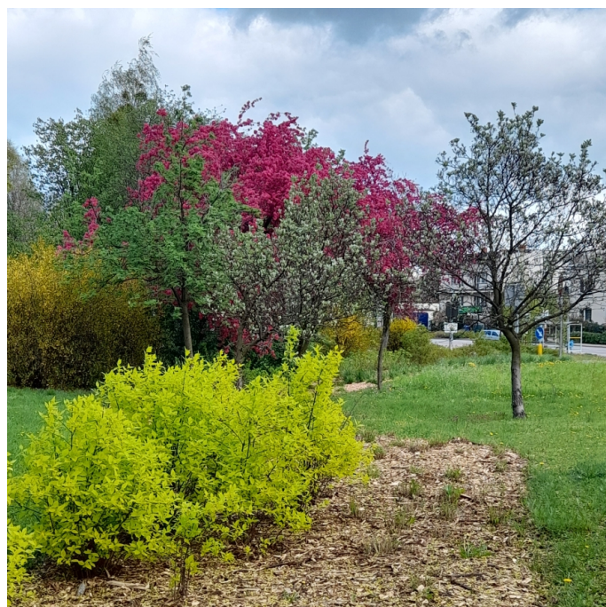
Park im. Szuberta