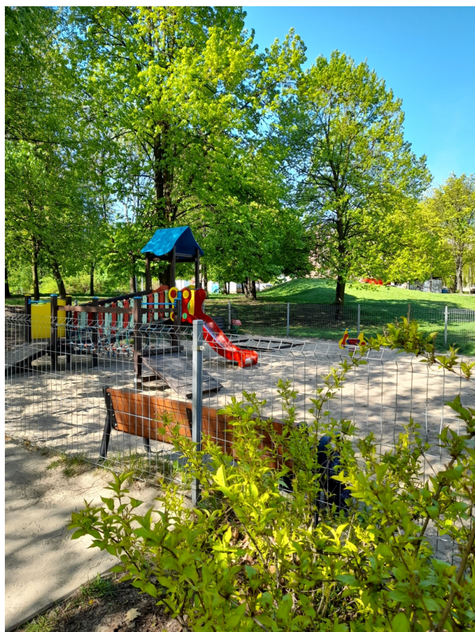
Park im. Szuberta