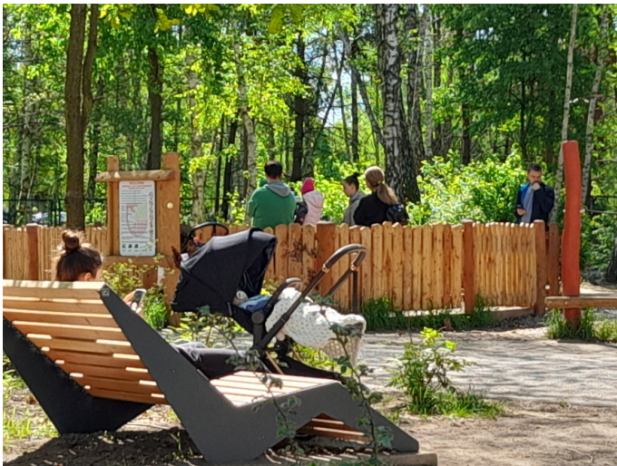
Park na ul. Powstańców

Nieprzerwanie, od 2018 roku trwa w naszym mieście realizacja projektu pod nazwą "Zielona Przestrzeń - rozwój i modernizacja terenów zieleni w Mieście Ząbki". Prace nad powiększaniem arealu zieleni miejskiej oraz budową stref wypoczynku i rekreacji w Ząbkach będą kontynuowane także w roku bieżącym. Na ten rozłożony na wiele lat projekt przeznaczono już łącznie 10 mln zł, pozyskane przez burmistrz Małgorzatę Zyśk dofinansowanie projektu wynosi 85%.