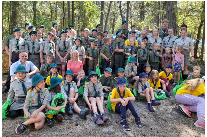
3 sierpnia 2022 r. obóz harcerski w Krynicy Morskiej Hufca ZHP w Ząbkach dh. Sylwia Kubicka

Zakres oferty i wymagane załączniki określa wzór oferty dostępny na stronie internetowej Biuletynu Informacji Publicznej Urzędu Miasta Ząbki: www.bip.zabki.pl .