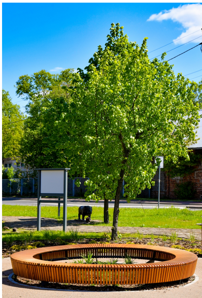
Skwer ul. Szpitalna - ul. 11-go Listopada