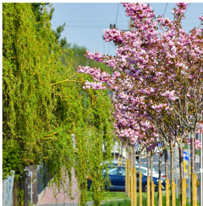
Nasadzenia ul. Rotmistrza Witolda Pileckiego