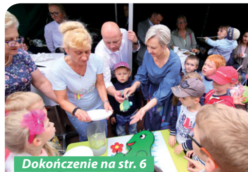
Dokończenie na str. 6

Dzień 18 maja 2018 roku to dla Publicznego Przedszkola nr 1 w Ząbkach „Zielony Dinek” bardzo ważna data. W tym właśnie dniu miał miejsce „Złoty Jubileusz”, uroczystość wielka, dostojna, przepełniona ogromną zadumą i wspomnieniami. Trudne zadanie, wiele myśli kłębiło się w głowach. Jak uczcić tak wielką rocznicę?