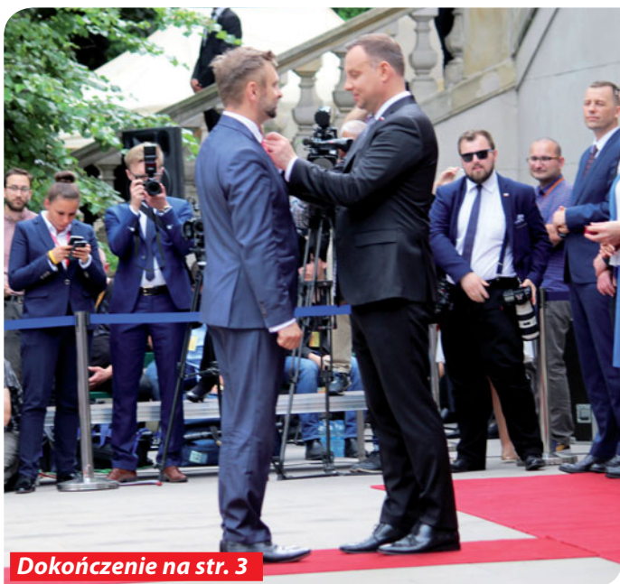
Dokończenie na str. 3