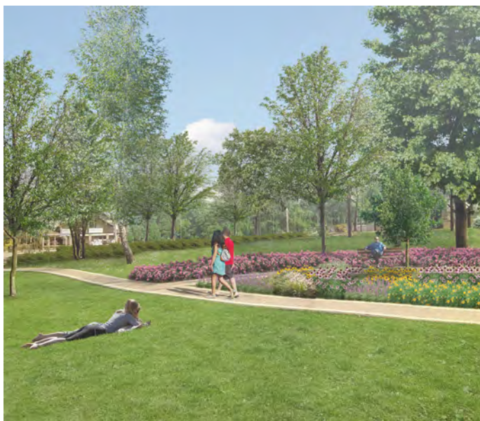
Park im. Szuberta