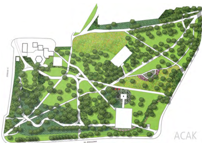
Park im. Szuberta - rzut