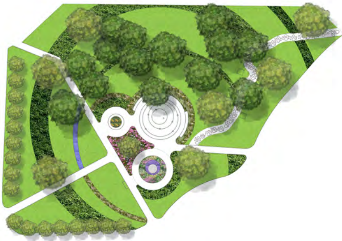
Ul. Szpitalna - rzut