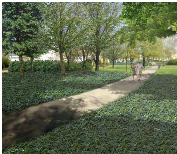
Park im. Szuberta