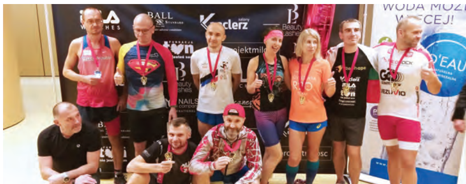
WYNIKI W BIEGU 48H NA BIEŻNI MECHANICZNEJ - KOBIETY