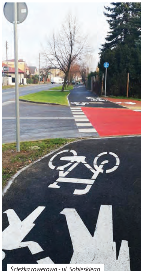
Ścieżka rowerowa - ul. Sobieskiego

W najbliższym, przedsięwziętym numerze, szczegółowo przybliżymy zrealizowane inwestycje w 2019 roku.