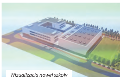
Wizualizacja nowej szkoły