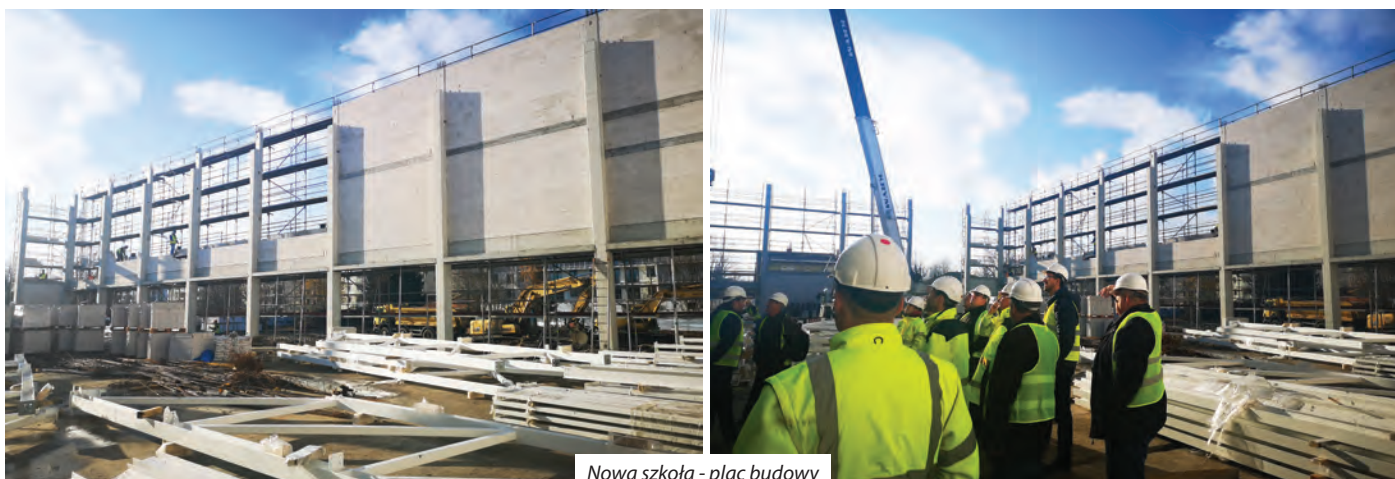
Nowa szkoła - plac budowy