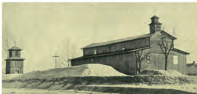
Widok na drewniany kościół w Ząbkach oraz dzwonicę od strony torów kolejowych - zdjęcie z 1935 roku