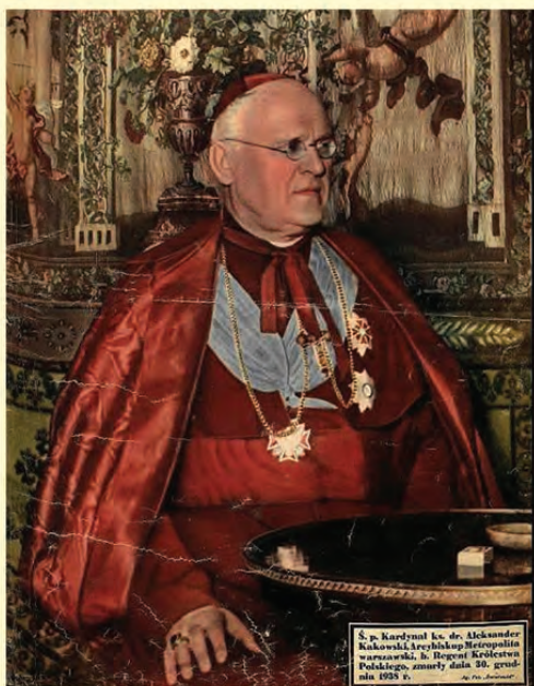
Arcybiskup Metropolita Warszawski ks. dr Aleksander Kakowski w 1916 r. poświęcił ząbkowski kościół