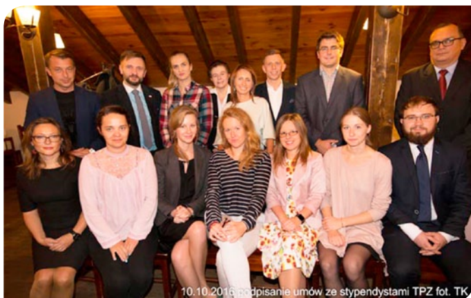
10.10.2016 podpisanie umów ze stypendystami TPZ