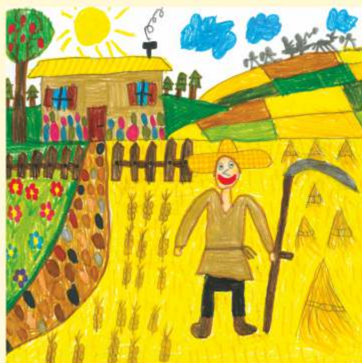
rys. Adam Bryś

W ojciech, gospodarz z podwarszawskiej wsi Ząbki, codziennie rozważał co ma zrobić.