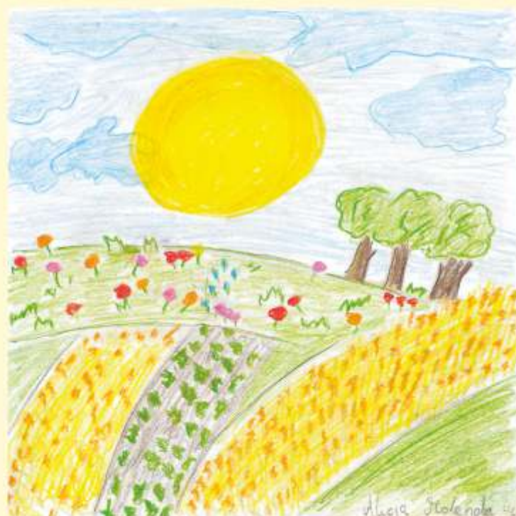
rys. Alicja Molenda

Od przeszło miesiąca drogi były pełne uchodźców, a serca ludności przepelniał lęk, przed nadciągającymi hordami bolszewików.