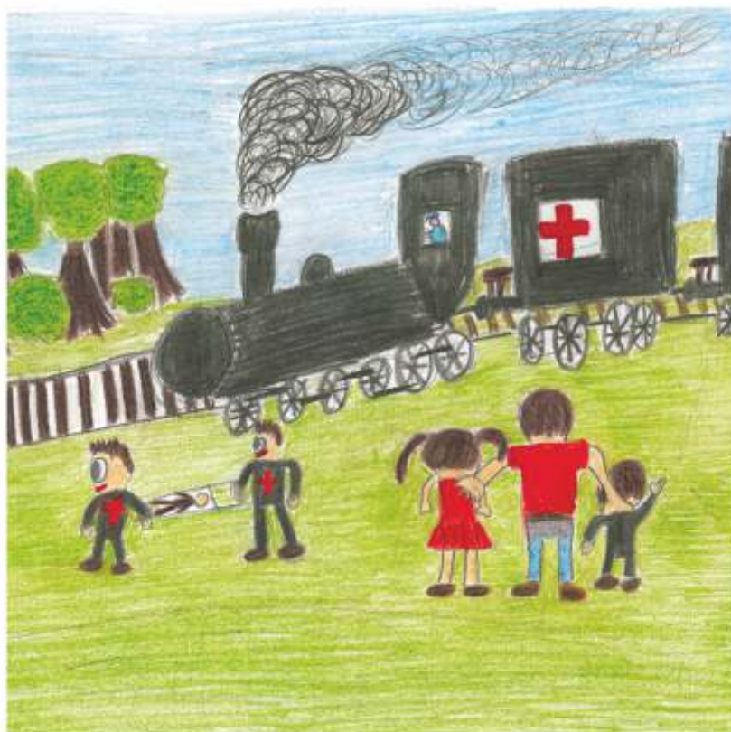
rys. Adam Sobiecki

Drogą z Bródna do Kobyłki i dalej Wołomina, w obydwu kierunkach maszerowali żołnierze.