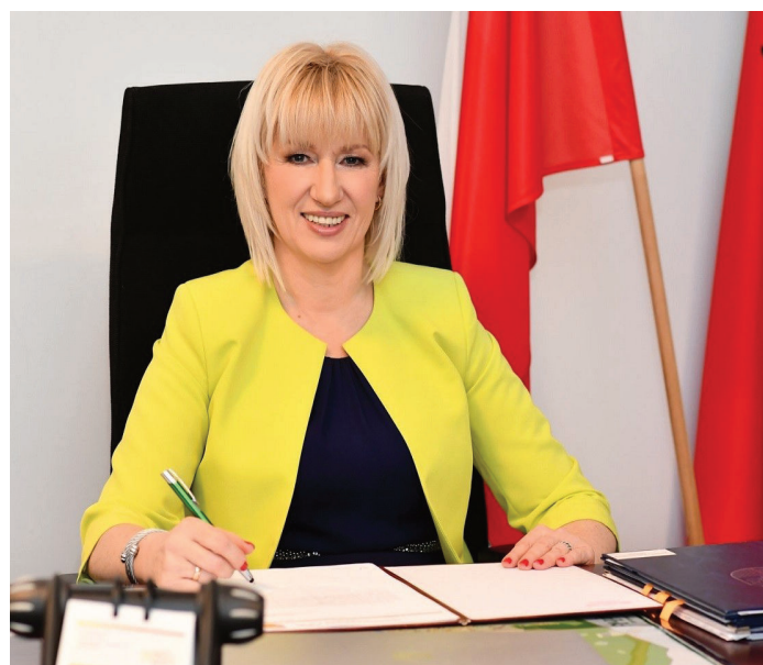
Fot. Burmistrz Ząbek Małgorzata Zyśk, www.zabki.pl

„Drodzy ząbkowscy przedsiębiorcy! W tym trudnym dla nas wszystkich okresie z racji wprowadzonego stanu epidemii na terenie Rzeczypospolitej Polskiej ruszamy ze specjalną akcją wspierającą lokalne firmy, które mają możliwość świadczenia usług na odległość lub prowadzą sprzedaż z dostawą do domu. Wszystkie firmy z Ząbek, które chcą wziąć udział w akcji oraz spełniają powyższe warunki prosimy o wysyłanie swoich ofert na adres promocja@zabki.pl w tytule wiadomości: AKCJA-KUPUJ Z DOMU! - nazwa firmy.”