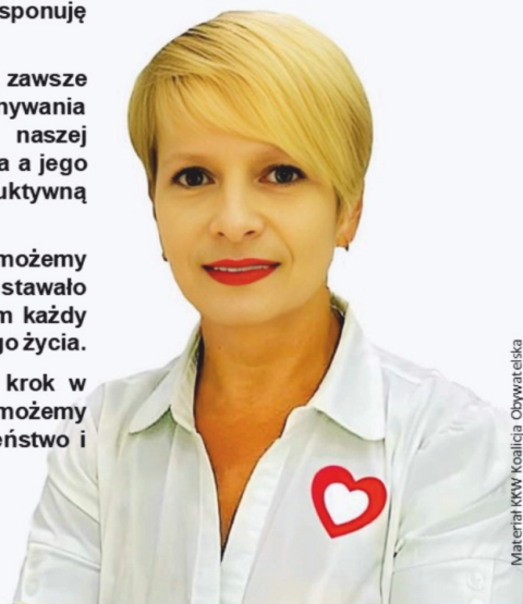
Materiał MKW Koalicja Obywatelska