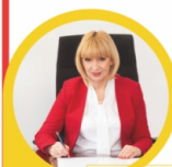
Burmistrz Miasta Ząbki