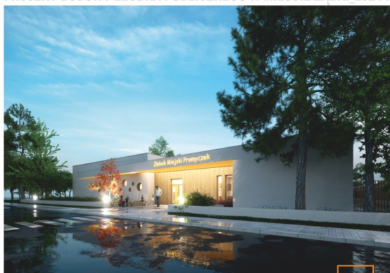
PROJEKT BUDOWY ŻŁOBKA PUBLICZNEGO W MIEŚCIE ZĄBKACH 2024 r.

Trwa budowa kolejnego przedszkola w naszym mieście. Inwestycja ma zostać zrealizowana do końca 2024 roku. Przedszkole z 12 oddziałami zapewni miejsca dla 300 przedszkolaków. Zwiększenie dostępności do usług edukacyjnych w zakresie wychowania przedszkolnego oraz rozbudowa i unowocześnienie placówek edukacyjnych jest w obecnej kadencji jednym z najważniejszych zadań inwestycyjnych w Ząbkach.