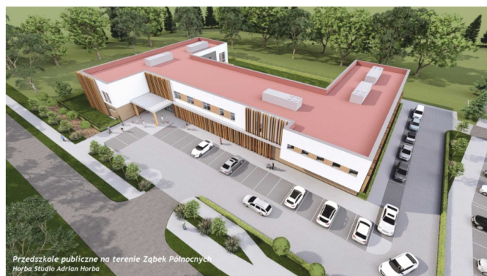
Przedszkole publiczne na terenie Ząbek Północnych Hydra Studio Adrian Horba

W ciągu ostatnich pięciu lat został również zrealizowany projekt zieleni za kwotę ponad 10 mln zł z dofinansowaniem na poziomie 85% z Unii Europejskiej. W ramach tego projektu powstały m.in. dwa nowe parki przy ul. Powstańców i ul. Andersena oraz tężnia i fontanna posadzkowa, jako elementy małej architektury. Zasadzono również 800 drzew