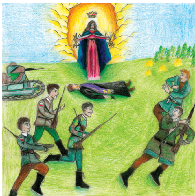
rys. Karolina Gromek

D ł poniedziałku 16 sierpnia dla Wojciecha zaczął się czas wytchnienia. Jego żona Halinka przynosiła z dworku coraz więcej dobrych informacji: wojska bolszewickie wycofują się; Polacy odzyskali Radzimin; na kilku odcinkach obrony Rosjanie uciekają w panice; polskie czołgi z 8 dywizji piechoty od strony stacji wojskowej Wesola, wspólnie z piechotą, wykonały skuteczne kontrataki, a bolszewicy widząc czołgi, uciekali w popłochu; strzelcy konni, którzy odpoczywali w Ząbkach, wzięli udział w odbijaniu Radzimina i ruszyli dalej w pościg za wycofującymi się Rosjanami, itd., itd., aż do dnia, w którym dowództwo 8 Dywizji Piechoty opuściło Ząbki.