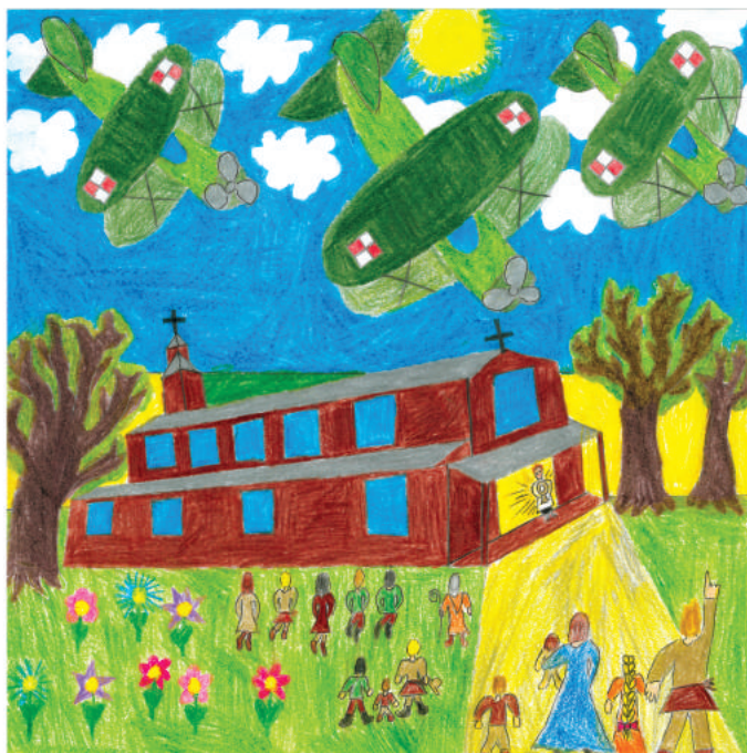
rys. Mateusz Bryś

Gdy po skończonej sumie ksiądz proboszcz dokonał wystawienia Najświętszego Sakramentu i wezwał wszystkich do udziału w nabożeństwie, pociechy Wojciecha wespół z innymi dziećmi stały przed kościołem z zadartymi w niebo głowami i obserwowały powracające z Radzimina aeroplany z 19 i 9 eskadry. Podobnie zresztą wyglądali urlopujący się w Ząbkach kawalerzyści z 1 pułku strzelców konnych: klęczeli co prawda pokornie przed kościołem, ale zamiast wzrok mieć skierowany w kierunku monstrancji, uważnie obserwowali powracające samoloty, licząc je, by mieć pewność, że wszystkie szczęśliwie wracają z boju.