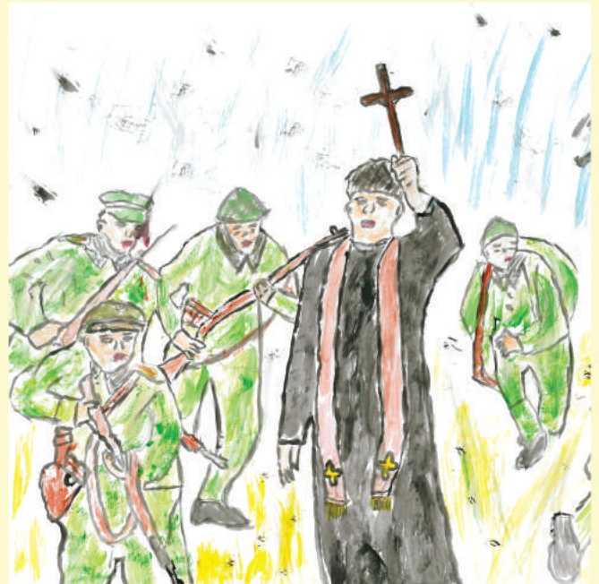
rys. Karolina Szulęcka

Około południa dowódca wrócił do dworku i wtedy po wsi rozeszła się straszna wiadomość - ten młody ksiądz, który wczoraj odprawiał nabożeństwo w ich kościółku, ten ksiądz, który przemawiał do wszystkich, że nie minie niedziela, a wróg będzie pobity, ten ksiądz poległ wczesnym rankiem, z krzyżem w ręku, na pierwszej linii frontu pod Ossowem.