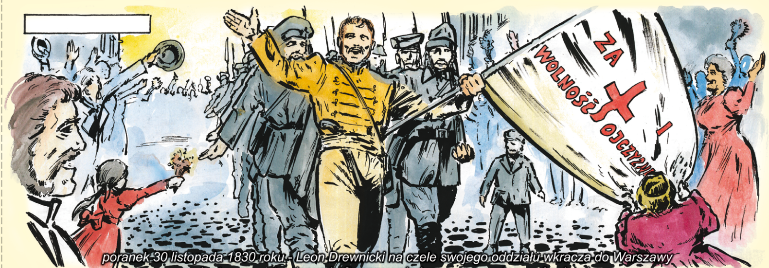
poranek 30 listopada 1830 roku - Leon Drewnicki na czele swojego oddziału wkracza do Warszawy w rękę trzyma sztandar wyhaftowany w jedną noc przez żonę - Agnieszkę