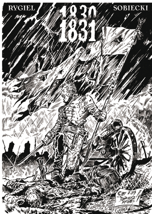
Okladka minikomisu o Leonie Drewnickim wydanego przez UM Ząbki w 2013 roku