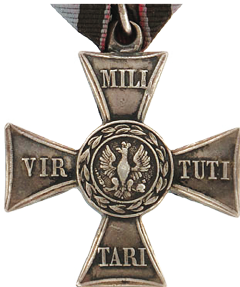
srebrny Order Virtuti Militari z 1831 roku