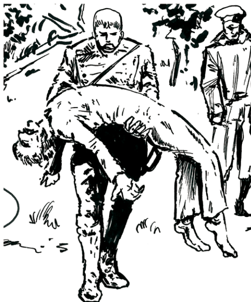
W boju pod Wawrem z ręki Leona zginął służący w armii carskiej jego kuzyn.