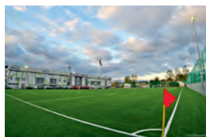
bezpłatne boiska i hale sportowe