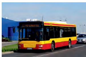
bezpłatne przejazdy liniami „Ząbki”