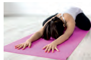
zniżki na zajęcia prowadzone w MOSiR