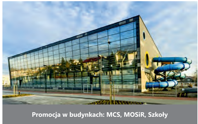
Promocja w budynkach: MCS, MOSiR, Szkoły