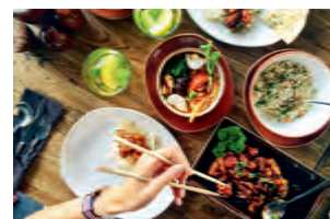
zniżki na produkty i usługi oferowane przez ząbkowskich przedsiębiorców