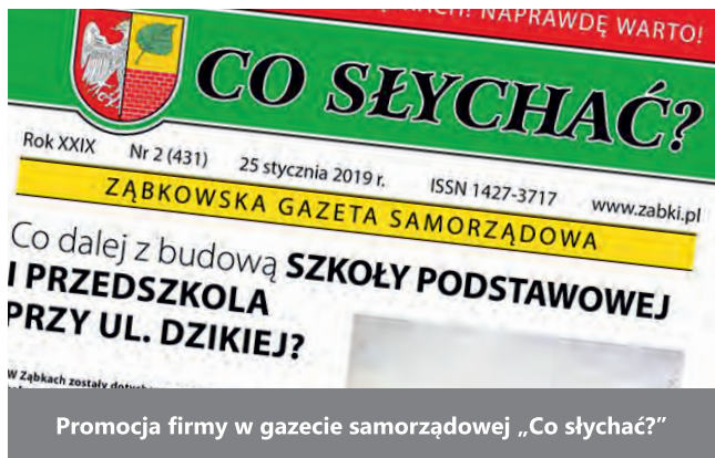
Promocja firmy w gazecie samorządowej „Co słycać?”