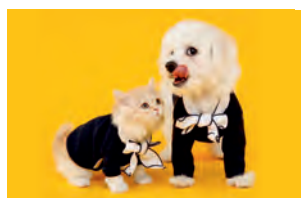
bezpłatne czipowanie oraz dopłaty do sterylizacji zwierząt