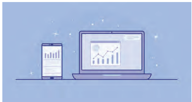
Promocja firmy na serwisach internetowych miasta Zabki