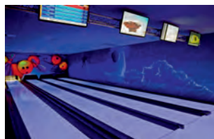
zniżka na kręgle