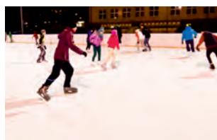
Zniżka na „Lato w mieście” oraz „Zima w mieście”