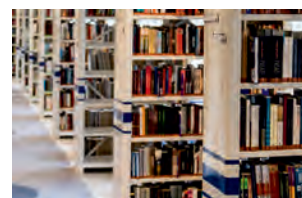
karta biblioteczna wbudowana w kartę mieszkańca