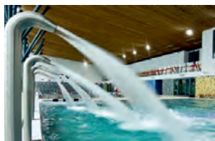
zniżka na basen