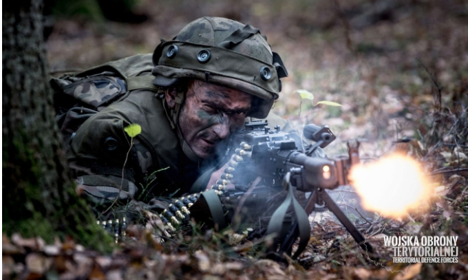
Wojska Obrony Terytorialnej

Trwająca w Ukrainie wojna uwypukliła znaczenie Wojsk Obrony Terytorialnej. Małe, dobrze zorganizowane oddziały składające się ze znającej teren ludności, żołnierzy WOT to efektywne wsparcie dla Wojsk Operacyjnych. 5. Mazowiecka Brygada zaprasza do wstąpienia w jej szeregi.