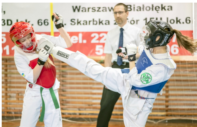
XIII Junior KYOKUSHIN CUP w Ząbkach