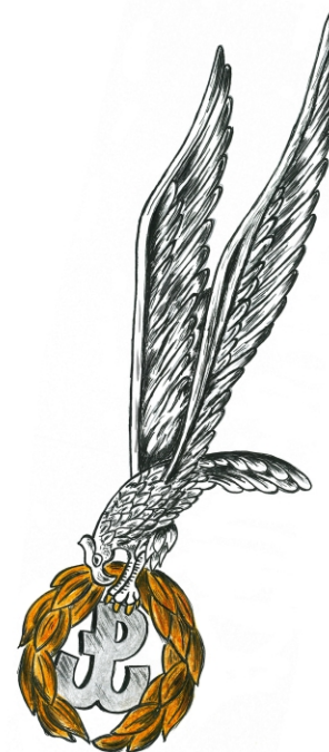
Znak spadochronowy Armii Krajowej