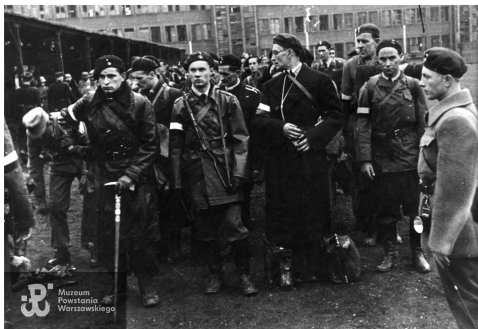
Żołnierze Batalionu „Golski” oddają broń na ul. Chałbińskiego.