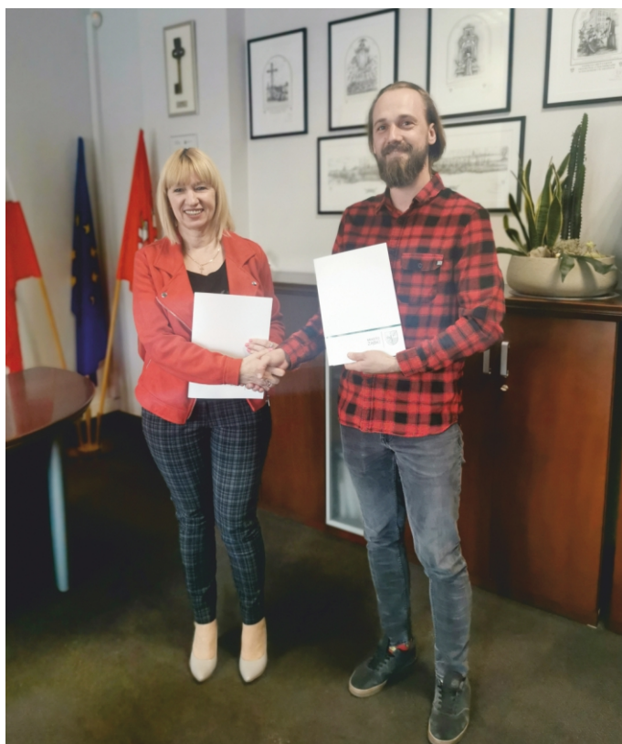
Podpisanie umowy na budowę tężni

Umowa na tężnię solankową w Parku Miejskim im Szuberta podpisana. Czas realizacji do 130. dni (pierwsza połowa września 2022 roku).