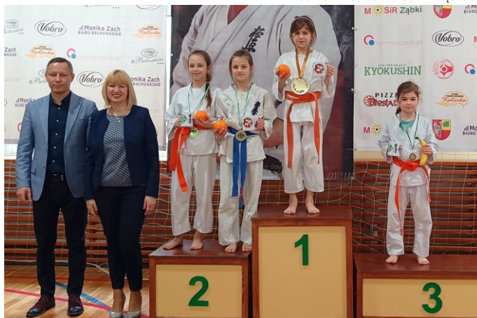
Najmłodsze dziewczynki z Ząbek