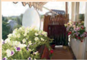
* zdjęcia z poprzedniej edycji konkursu