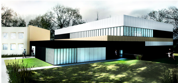
Hala sportowa przy Szkole Podstawowej nr 2