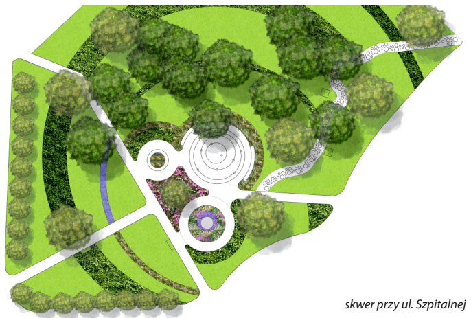
skwer przy ul. Szpitalnej

WYCINKA I PIELEGNACJA DRZEW METODĄ ALPINISTYCZNĄ 504 040 358