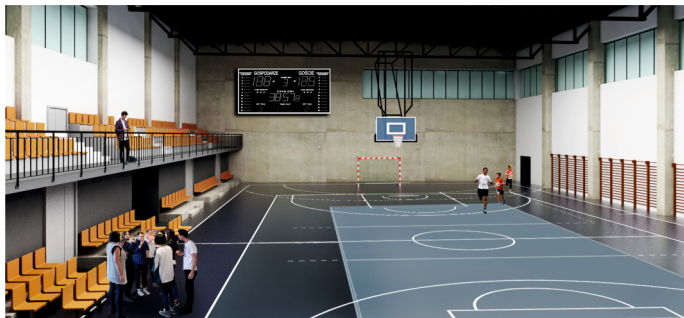
Hala sportowa przy Szkole Podstawowej nr 2