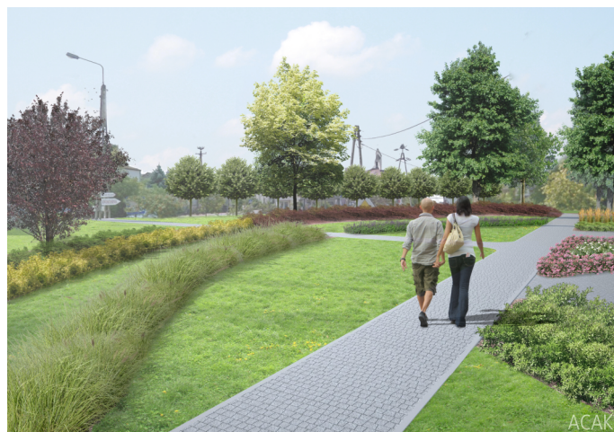
skwer przy ul. Szpitalnej