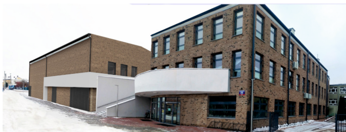
Hala sportowa przy Szkole Podstawowej nr 1