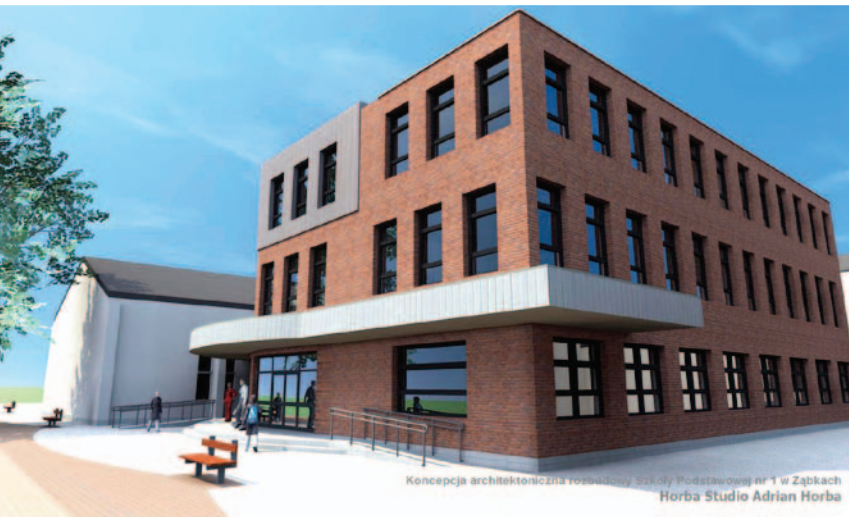
Koncepcja architektoniczna rozbudowy Szkoły Podstawowej nr 1 w Ząbkach Horba Studio Adrian Horba