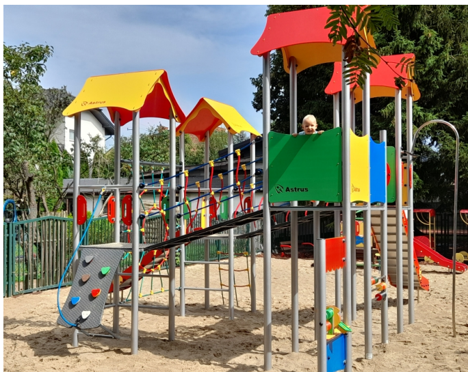
Plac zabaw przy ul. Wyspiańskiego