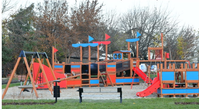
Plac zabaw przy MOSiR

- Na działce przy skrzyżowaniu ulic Kopernika i Szwoleżerów zagospodarowaliśmy teren pod nowy skwer i tematyczny plac zabaw. Powstały tam ścieżki spacerowe przy których ustawiliśmy ławki i kosze, nasadziliśmy krzewy i kwiaty, a na bezpiecznej nawierzchni zostały zamontowane zabawki – dinozaury do wspinania oraz huśtawka. Aktualnie realizujemy dużą inwestycję nowego parku w pasie ul. Nowo-Ziemowita. Przy ul. Różanej zostały już zamontowane dwie inteligentne tężnie solankowe. Nieopodal nowego parku, przy ul. Reymonta, powstanie nowa strefa aktywności dla dzieci, młodzieży i dorosłych. Na placu zabaw dla dzieci umieścimy pajęczaka czyli linową zabawkę ze zjeżdżalnią oraz huśtawkę wahadłową. Środki na zabawki dla dzieci pochodzą z Budżetu Obywatelskiego. Dla młodzieży i dorosłych wybudowane zostanie boisko do koszykówki i parkour, ustawimy stolik do szachów oraz zamontujemy huśtawki dla dorosłych. Ponieważ