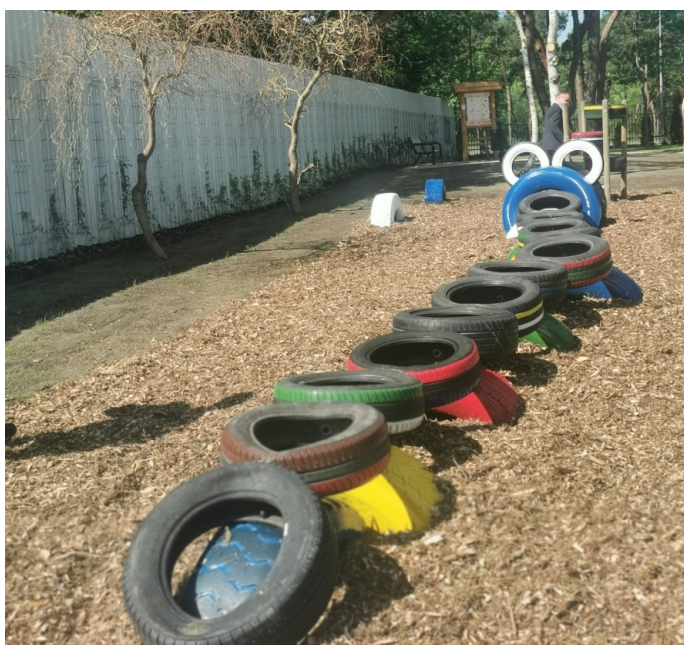
Eko-skwer przy ul. Zycha