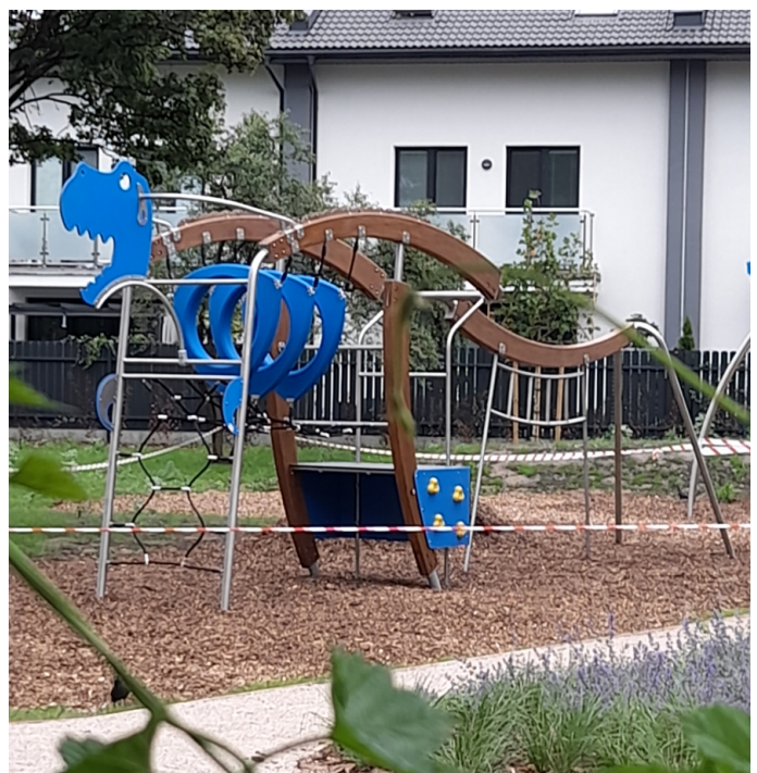
Plac zabaw przy ul. Kopernika/Szwolężerów

Ponadto zostały zamontowane cieszące się dużą popularnością trzy trampoliny oraz karuzela i koparka. Dla miłośników ćwiczeń wybudowaliśmy siłownię zewnętrzną. Z myślą o zapewnieniu użytkownikom komfortowego wypoczynku zostały też zamontowane zadaszenia chroniące przed słońcem. W minionym roku powstał również tematyczny Eko Skwer przy ul. Zycha. Mając na uwadze potrzeby najmłodszych mieszkańców skwer ekologiczny zostanie wyposażony w huśtawkę, samochód (śmieciarę) na