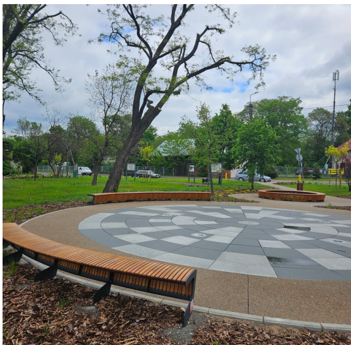
Fontanna posadzkowa na skwerze 11 Listopada/Szpitalna