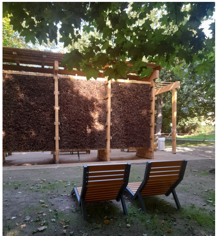
Tężnia w Parku Miejskim Szuberta

- Z uwagi na fakt, że nasze place zabaw, szczególnie po północnej stronie Żabek, zostały mocno wyeksploatowane postanowiliśmy wybudować je od nowa bądź doposażyć w nowe zabawki i urządzenia. Dotyczy to m.in. miejskiego placu zabaw przy ul. Wyspiańskiego, gdzie wymieniona została nawierzchnia, zamontowaliśmy duży zestaw zabawkowy z dwoma zjeżdżalniami, huśtawkę oraz karuzelę linową. Na placu zabaw przy ul. Prusa wymieniliśmy nawierzchnię, zamontowaliśmy karuzelę linową, równoważnię, huśtawki i urządzenie do zabawy piaskiem. Na skrzyżowaniu ulic Batorego i Wolności wybudowany wcześniej plac zabaw został ogrodzony oraz wzbogacony o huśtawkę wagową i karuzelę linową. Środki przeznaczone na tę inwestycję pochodziły z Budżetu Obywatelskiego. Najwięcej miejsca mieliśmy jednak do zagospodarowania na placu zabaw między basenem a Miejskim Ośrodkiem Sportu i Rekreacji przy ul. Słowackiego. Tutaj posiłkowaliśmy się Budżetem Obywatelskim, dzięki czemu została wybudowana pierwsza w Żabkach tyrolka.