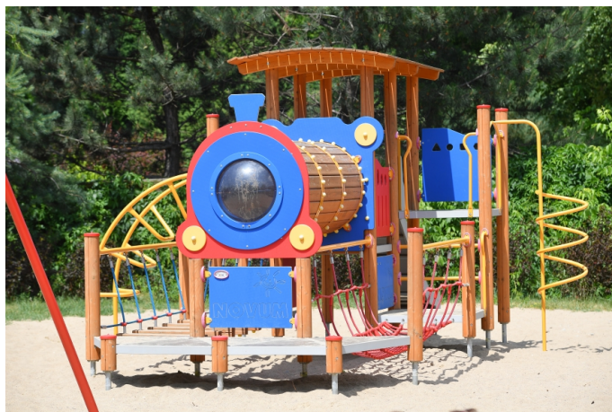
Plac zabaw przy ul. Wolności

sprężynach), karuzelę, zabawkę do wspinania i dwa hamaki. W 2022 roku, w ramach realizacji projektu „Zielona Przestrzeń w Mieście Ząbki” wybudowaliśmy tężnię solankową w Parku Szuberta oraz rozpoczęliśmy zagospodarowywanie skweru u zbiegu ulic 11 Listopada i Szpitalnej, gdzie powstała fontanna posadzkowa i ścieżki spacerowe oraz ciekawa ścieżka edukacyjna „Zwierzęta leśne”. Na skwerze zostały nasadzone drzewa, krzewy i kwiaty. Całość uzupełniają ławki i kosze. Uruchomienie fontanny planowane jest na pierwszą połowę czerwca bieżącego roku. To już druga, znacznie okazałsza, fontanna posadzkowa w naszym mieście.