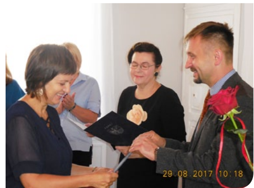
Referat Oświaty i Pomocy Społecznej UM Ząbki

Łącznie do Urzędu Miasta Ząbki w terminie do 30 czerwca 2017 r. wpłynęło 17 wniosków od nauczycieli zatrudnionych w publicznych przedszkolach, szkołach podstawowych i gimnazjach prowadzonych przez Miasto Ząbki z prośbą o wszczęcie postępowania egzaminacyjnego na stopień nauczyciela mianowanego. Wszystkie wnioski wraz z dołączoną dokumentacją spełniały wymogi formalne zgodnie z obowiązującymi przepisami prawa w tym zakresie.