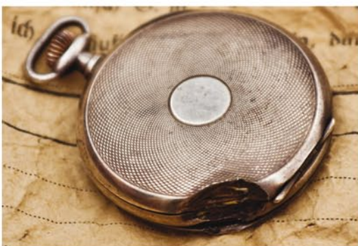
Zegarek porucznika, ze śladem uszkodzenia przez jeden ze śmiercionośnych pocisków