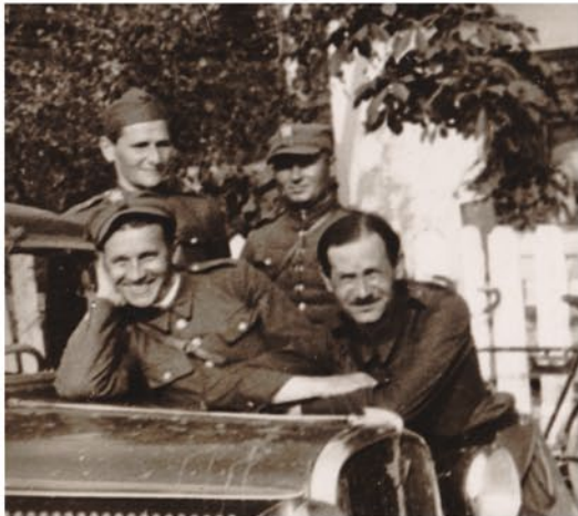
Zdjęcie z kolegami podczas szkolenia w Centrum Wyszkozenia Łączności w Zegrzu (górný rząd, pierwszy z lewej)