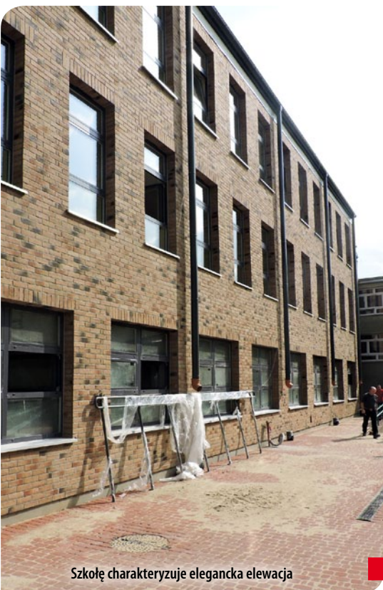
Szkołę charakteryzuje elegancka elewacja

T o już kolejny obiekt oświatowy poddany znaczącej rozbudowie. Wcześniej zostały rozbudowane Szkoła Podstawowa Nr 2, a potem Szkoła Podstawowa Nr 3. Teraz jesteśmy świadkami przebudowy ząbkowskiej „Jedynki”. Roboty są bardzo zaawansowane, praktycznie mamy do czynienia z ostatnimi szlifami. Obiekt byłby gotowy już wcześniej, ale proces budowlany nieco się przedłużył z uwagi na dokonane korekty w projekcie budowlanym, co niosło ze sobą konieczność uruchomienia procedury o wydanie zmienionego pozwolenia na budowę. Nie bez znaczenia były też uwagi jednego z sąsiadów, którego aktywność administracyjna również wpłynęła na opóźnienia w planowanym terminie zakończenia budowy.