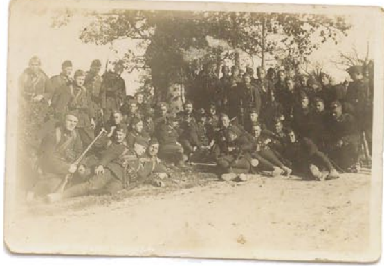
zdjęcie z 78 pułku Strzelców Słuckich (datowanie 1924-25 rok)